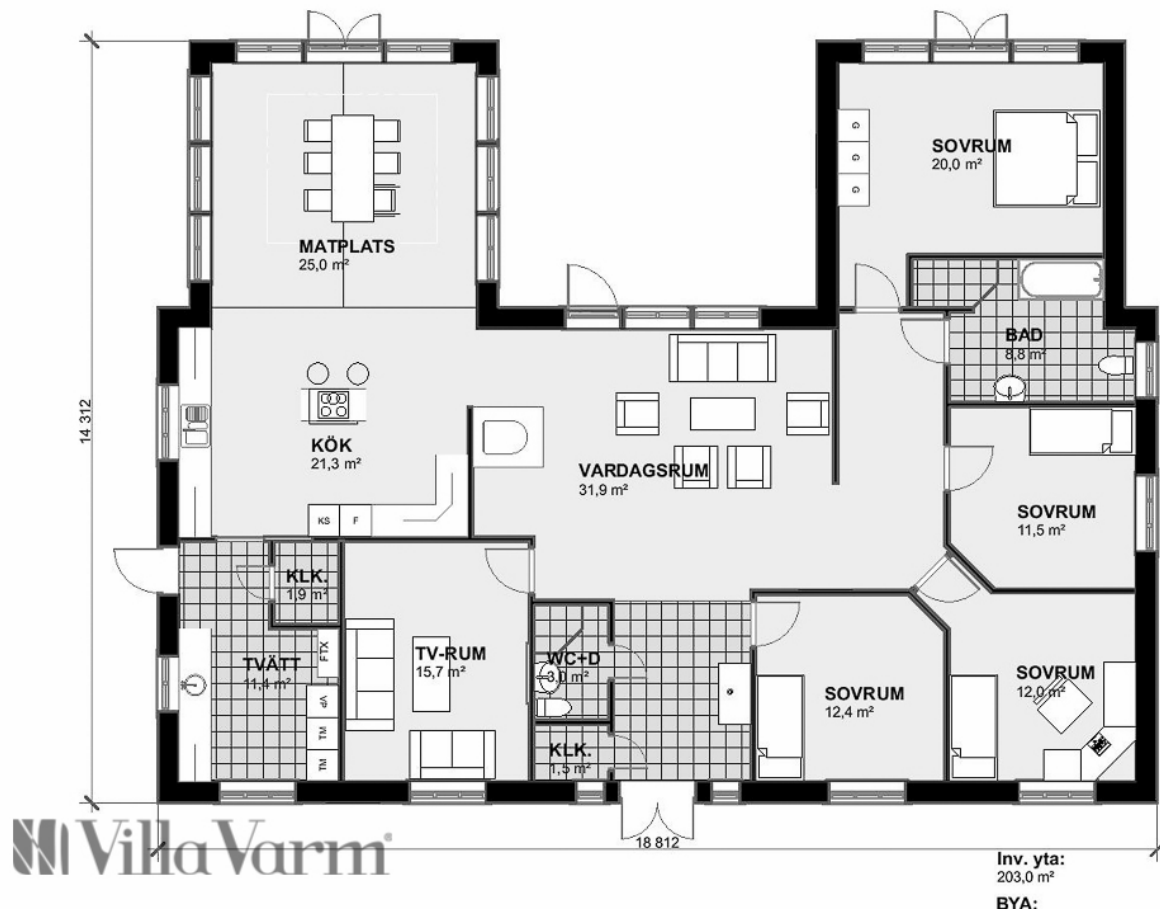
Planlösning Villa Almby

Villa Renkullen Villa Sandskär Villa Sörfors Villa Stöcksjö Villa Tranås