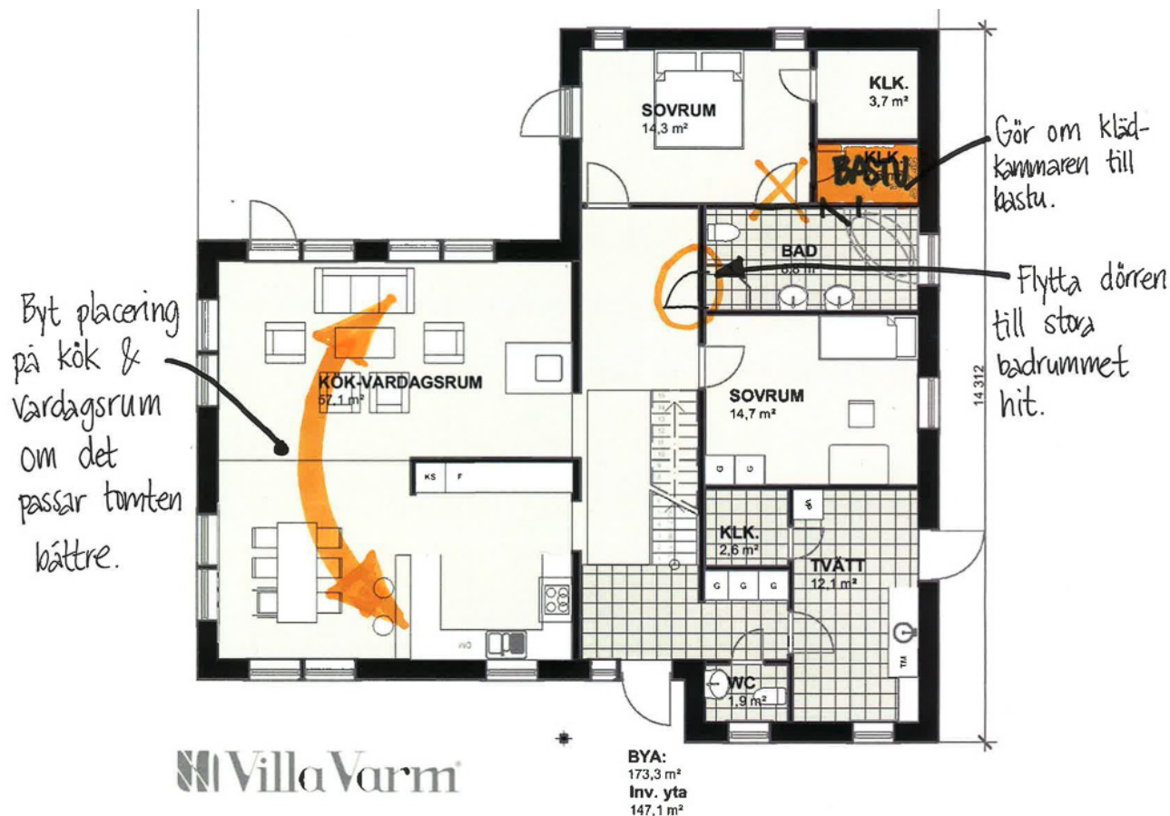
Ändring planlösning Villa Borgfors