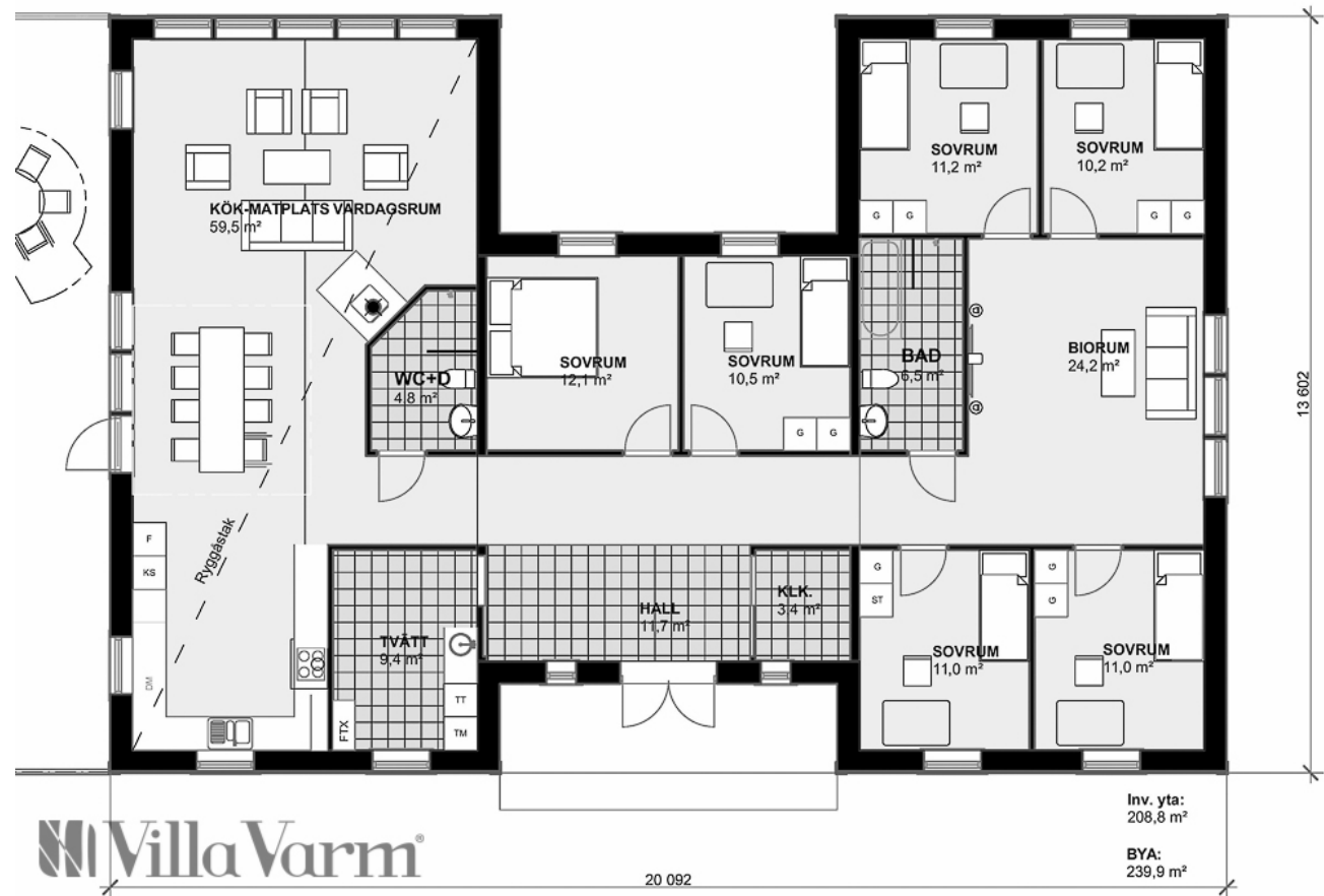
Planlösning Villa Stöcksjö